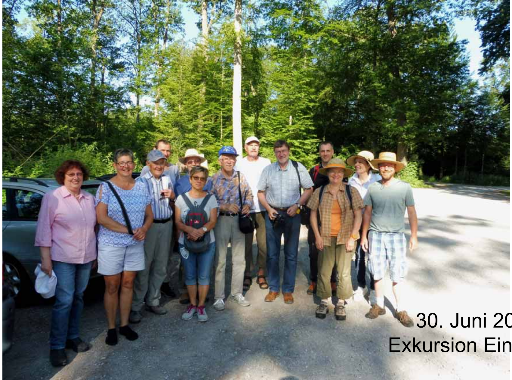
30. Juni 2019 Exkursion Einsiedel