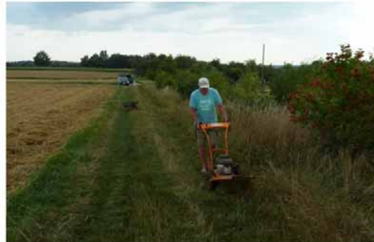
Pflegeinsatz 7. Juli 2018

Bei Fragen gerne an mich wenden : Rainer Stöhr NABU Gruppe Wannweil 07121 / 585414 stöhr-wannweil@t-online.de