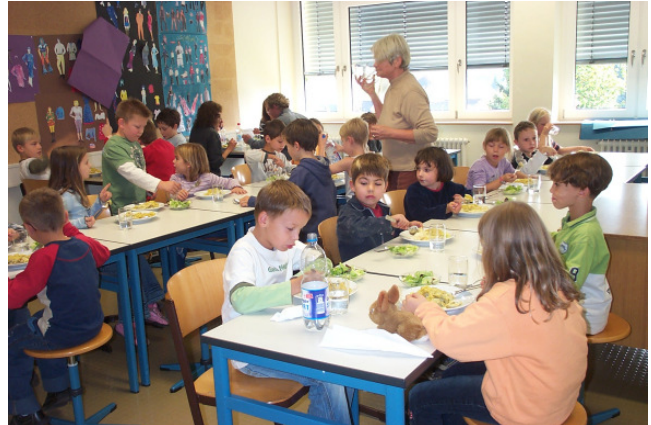
Donnerstags essen über 60 Schüler und Lehrer in der Mensa

Angebot: Angeboten werden täglich 2 Menüs (Normalkost und fleischlos). Das Essen wird in Abstimmung mit der Jahreszeit und dem Marktangebot geliefert. Unser Essenslieferant, die Firma „Der Party Profi“ aus Kirchentellinsfurt, die rund 10 Schulen in der Region versorgt, garantiert uns eine frische und ausgewogene Kost, zum Teil aus eigenem Anbau (z.B. Kartoffeln ausschließlich ohne Pestizide u.a.). Den ausländischen Mitbürgern zuliebe wird das Tagesessen schweinefleischfrei hergestellt.