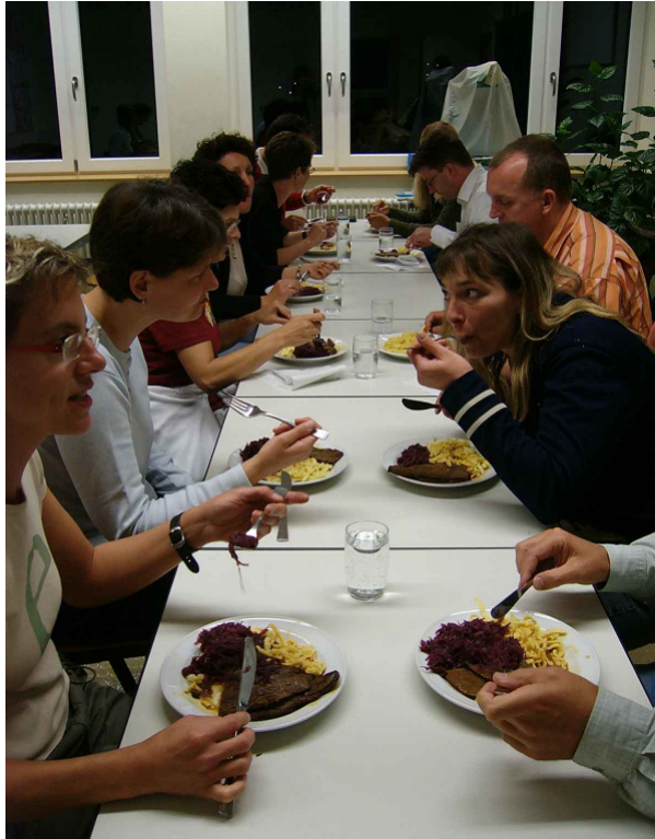
Das Essen mundet: An einem Freitagabend Ende September 2006 testeten die Eltern, seit Anfang Oktober 2006 sitzen die Kinder in der Wannweiler Mensa

Seit Anfang Oktober 2006 können Schüler, Schülerinnen und Lehrkräfte der Uhlandschule sowie die Mitarbeiterinnen des Fördervereins dienstags, mittwochs und donnerstags im Mensale zwischen zwei Menüs wählen, Normalkost oder fleischlos, für nur 3,50 Euro pro Mahlzeit. Die Mitgliedschaft im Förderverein der Uhlandschule e.V. (Jahresbeitrag 15 Euro) ist nicht Voraussetzung für die Nutzung des Essensangebotes.