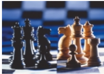
Schach, das königliche Spiel, nun auch an der Uhlandschule

Schach ist - von der Freude am Spiel einmal abgesehen - wie kaum ein anderes Spiel geeignet, das Abstraktionsvermögen zu schulen und Menschen zu befähigen, logisch und strategisch richtig denken zu lernen.