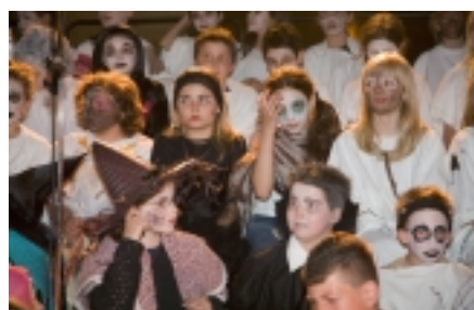
In Musiktheater-AG wird ein selbst entwickeltes Theaterstück präsentiert