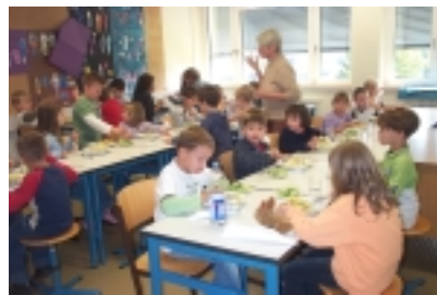
Mensa in der Uhlandschule

Diese Angebote werden – teilweise mit Unterstützung der örtlichen Vereine (insbesondere der NABU Ortsgruppe Wannweil) von (ehrenamtlichen) Jugendbegleiterinnen und Jugendbegleitern durchgeführt, die größtenteils Erfahrungen in der Betreuung von Kindern und Jugendlichen mitbringen. Wo es an